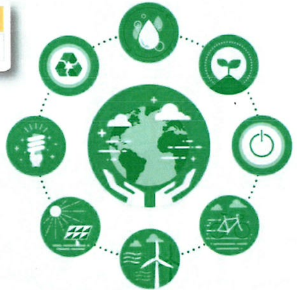
REF Graphic: "Designed by macrovector / Freepik"

ผู้เข้าอบรมต้องมีเวลาเรียนไม่ต่ำกว่า 80% จึงจะได้รับวุฒิบัตร จากสำนักงานพัฒนาวิทยาศาสตร์และเทคโนโลยีแห่งชาติ (สวทช.)