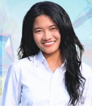
ปรายฟ้า ห่องทอง เยาวชน Mae Fah Luang Human Rights Club