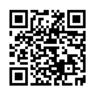
รายละเอียดเพิ่มเติม

กองการต่างประเทศ กลุ่มขับเคลื่อนทุนมนุษยนานาชาติ โทรศัพท์ ๐ ๒๖๑๐ ๕๔๖๔ (สุภาพ) ไปรษณีย์อิเล็กทรอนิกส์ supanee.j@mhesi.go.th