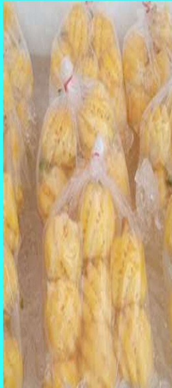
บรรจุถุงละครึ่งกิโล