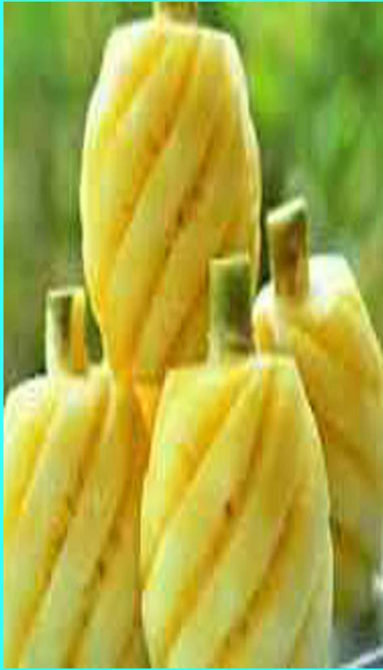
ผลปอกแล้ว