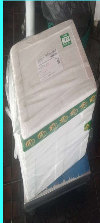
1 กล่องโฟม มี 16 ถุง

กล่องโฟมละ 700 บาท ไม่รวมค่าขนส่งตามจริง ขึ้นอยู่กับสถานที่จังหวัด และวิธีการส่ง