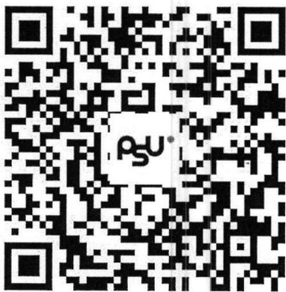
QR Code แบบตอบรับเข้าร่วมกิจกรรม