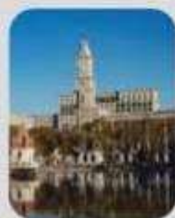
เดินชมทัศนียภาพ รอบ ๆ มหาวิทยาลัย