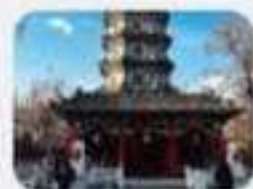
วัดจี้เสื่อ , วัดขงจื้อ