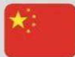
เรียนภาษาจีน