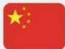
เรียนภาษาจีน