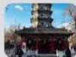
วัดจี้เสื่อ , วัดขงจื้อ