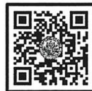
QR-Code ลงทะเบียนอบรม

ผู้อำนวยการสำนักงานบริการวิชาการ ปฏิบัติการแทนอธิการบดีมหาวิทยาลัยศิลปากร