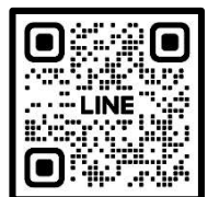
QR-Code ลงทะเบียนอบรม