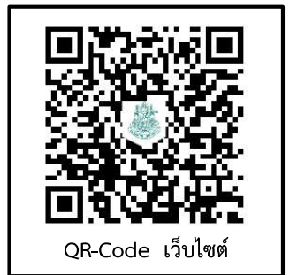
QR-Code เว็บไซต์

● กรณีผู้สมัครเข้ารับการฝึกอบรมดำเนินการชำระเงินค่าลงทะเบียนล่วงหน้า แต่ไม่สามารถมาเข้ารับการฝึกอบรมได้ กรุณาแจ้งมหาวิทยาลัยล่วงหน้าอย่างน้อย ๕ วัน หากไม่มีการแจ้งล่วงหน้าจะถือว่าท่านมีความประสงค์เข้ารับการฝึกอบรมตามปกติ และไม่สามารถขอรับเงินคืนได้ในภายหลัง