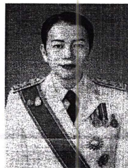
๒. นางพรพิมล นิลทจันทร์ รองเลขาธิการสำนักงานศาลรัฐธรรมนูญ และอดีตนักตรวจสอบภายใน สำนักงานตรวจสอบภายใน มหาวิทยาลัยธรรมศาสตร์