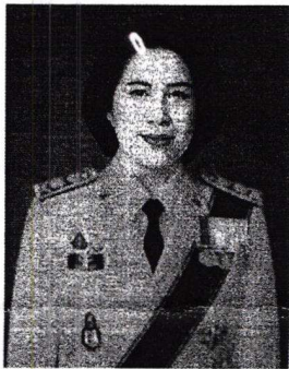
๑. นางเกล็ดนที มโนสันติ รองผู้ว่าการตรวจเงินแผ่นดิน

หากท่านผู้ใดมีข้อมูล ข้อเท็จจริง และข้อคิดเห็นเกี่ยวกับบุคคลผู้ได้รับการเสนอชื่อ ให้ดำรงตำแหน่งกรรมการตรวจเงินแผ่นดิน