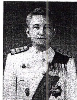
๔. นายยุทธพงษ์ อภิรัตน์รังษี อธิบดีอัยการ สำนักงานคดีทรัพย์สินทางปัญญา และการค้าระหว่างประเทศ สำนักงานอัยการสูงสุด