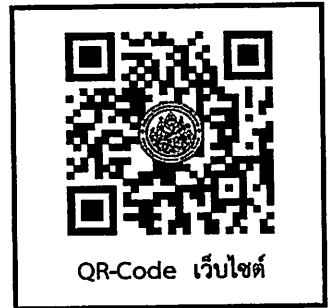
QR-Code เว็บไซต์

วิธีการสมัคร สามารถสมัครและดาวน์โหลดรายละเอียดหลักสูตร ได้ที่ Website : suas.su.ac.th สอบถามรายละเอียดได้ที่ ID Line : @suas (ใส่ @ นำหน้าด้วย) ติดต่อเจ้าหน้าที่ หมายเลขโทรศัพท์ ๐๒ ๑๐๕ ๔๖๘๖ ต่อ ๑๐๐๒๖๖ , ๑๐๐๒๙๒ โทรศัพท์มือถือ ๐๘๕ ๒๒๒ ๔๒๑๘