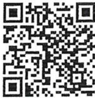
ใบสมัครฝึกอบรม

หมายเหตุ สแกนไฟล์เอกสารส่งเมล เอกสารฉบับจริงส่งวันที่ฝึกอบรม