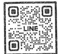
QR-Code เว็บไซต์