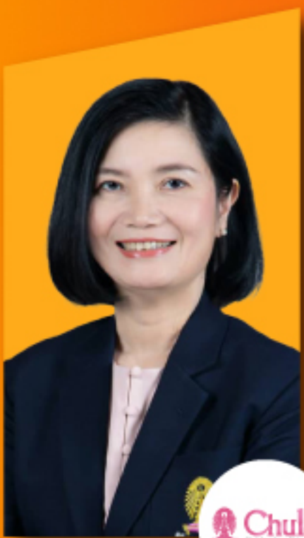
ศ. ส.พ.ญ. ดร.เกวลี จิตรตรงค์