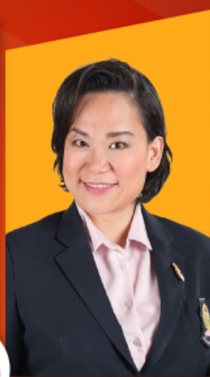
รศ. ดร.ณัฐชา ทิวแสงสกุลไทย