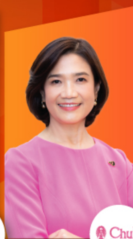
ศ. ร.ต.อ.หญิง ภญ. ดร.สุชาดา สุขหรั่ง