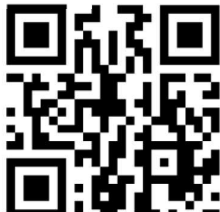
QR Code แบบสอบถาม