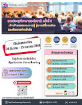
8th national-con poster.jpg 405K

-- Graduate School Suan Sunandha Rajabhat University 1 U-Thong Nok, Dusit, Bangkok 10300 Tel. +6621601174-75 Fax. 021601177