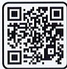
สิ่งที่ส่งมาด้วย ๓